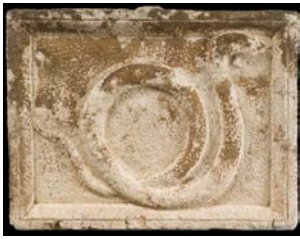
Serpent. Relief païen d'époque romaine, recueilli à Thasos.