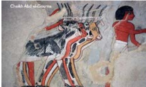
Tombeau de Sennefer, Cheikh Abd el-Gourna, XVIII e dynastie, milieu du XV e siècle av. J.-C.