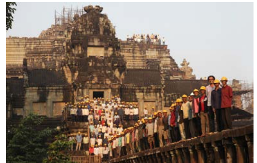
Pascal Royère et les ouvriers du chantier de restauration, devant le Baphuon, 2011 © Christophe Lovigny.

Allocution de conclusion par Sa Majesté NORODOM Sihanouk, roi du Cambodge.