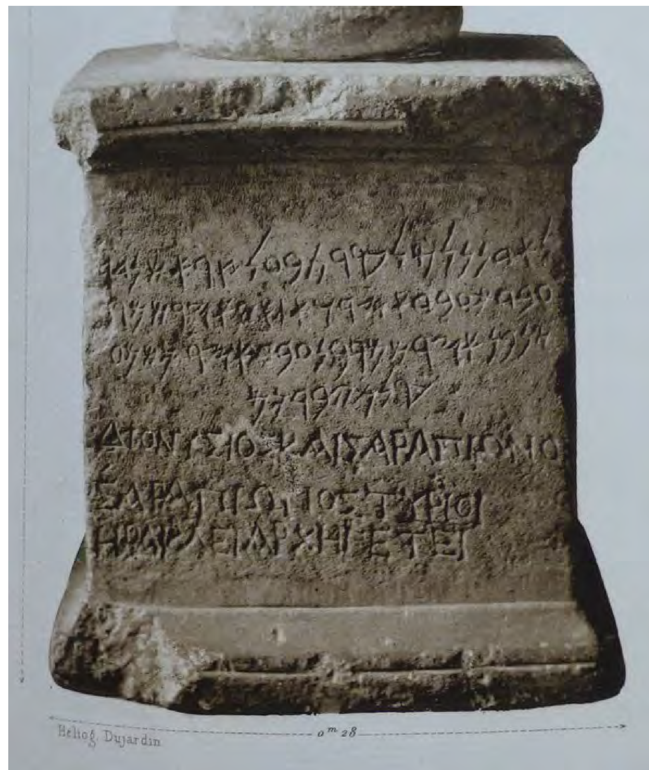
3 - CIS I, 122. Dédicace de Dionysios et Sarapion, fils de Sarapion, de Tyr, à Hercule Archégète. 180 a. J.-C. (?).