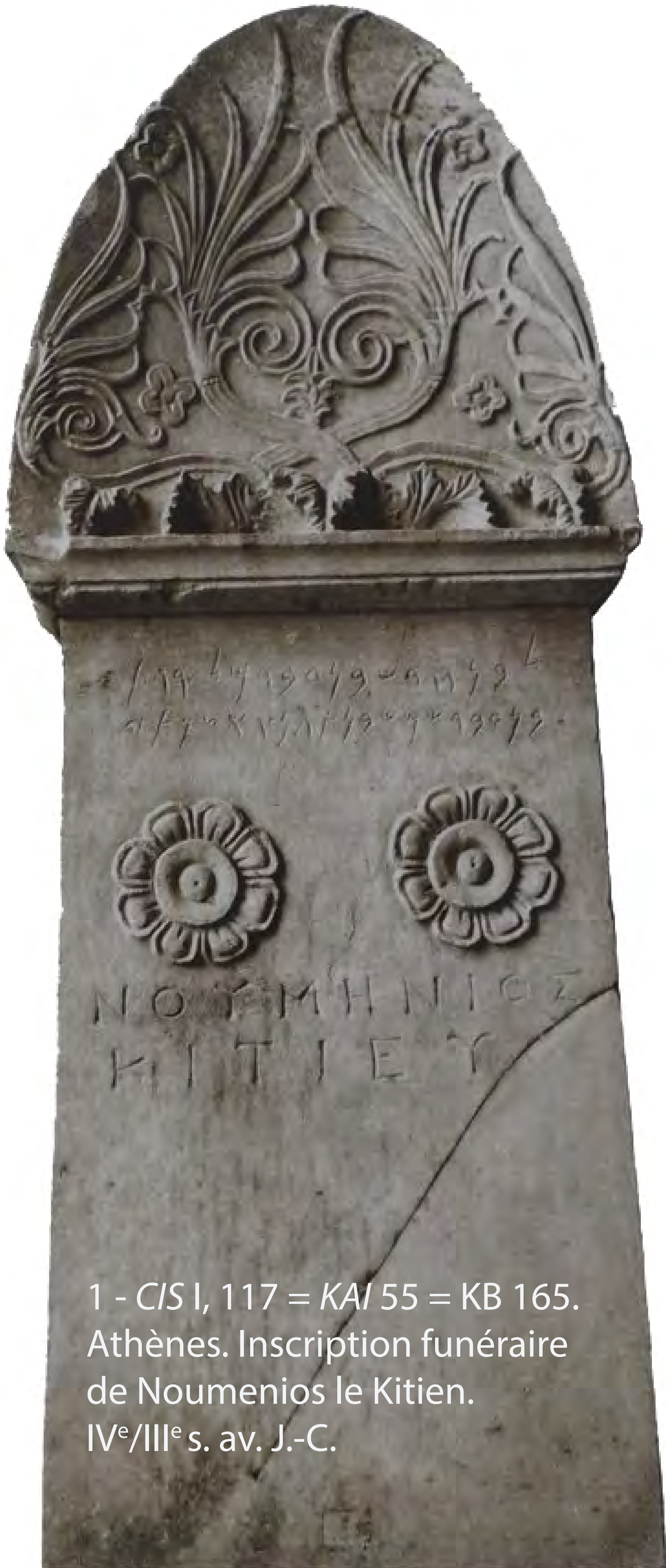
1 - CIS I, 117 = KAI 55 = KB 165. Athènes. Inscription funéraire de Noumenios le Kitien. IV e /III e s. av. J.-C.