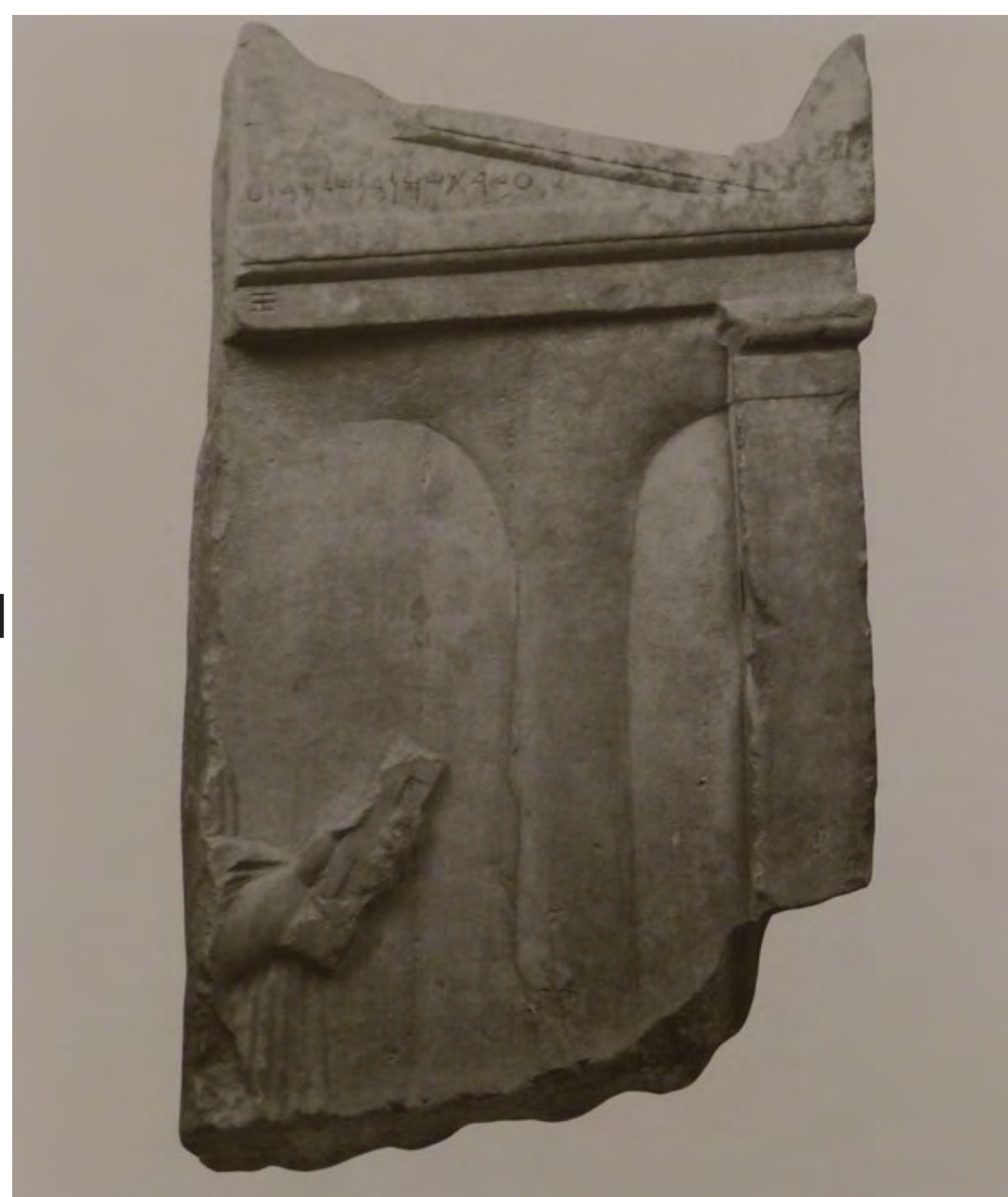
4 - CIS I, 121. Athènes. Stèle d'Abdeshmun. Entre 400 et 375 (?). O. Masson, « Recherches sur les Phéniciens dans le monde hellénistique », BCH 93 (1969) p. 698 = W. Röllig, « Alte und neue phönizische Inschriften aus dem Aegaeischen Raum », Neue Epigraphik für Semitische Epigraphik 1, 1972, n° 2.