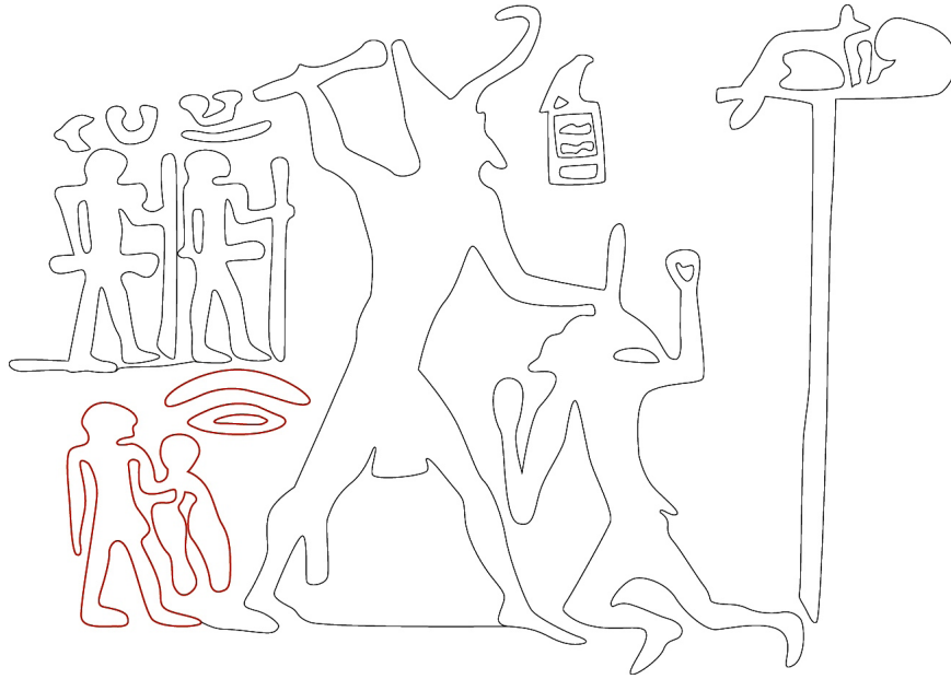
Fig. 4. Partie gauche du panneau médian du bas-relief de Den à Faras Oum al-Zuebin [fac-similé P. Tallet].

Ce jeu graphique, qui correspond à l'évidence à une fantaisie érudite d'un scribe dont le talent est indéniable, constitue un cas unique, parmi les étiquettes, de lecture tridimensionnelle faisant apparaître la complémentarité entre les inscriptions des deux faces.