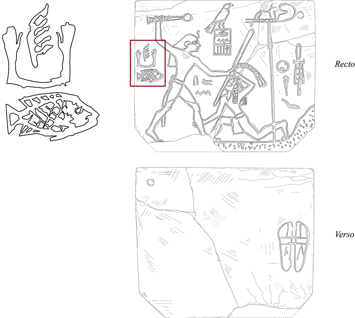
Fig. 1. L'étiquette MacGregor avec, encadré en rouge et agrandi sur la gauche, le groupe hiéroglyphique étudié dans cette note [dessin de l'auteur].

Sans fournir la réponse de façon explicite, les textes de l'étiquette pourraient néanmoins apporter la solution au problème. Il faut pour cela la retourner et s'intéresser à l'inscription figurant au revers. En effet, cette étiquette, comme deux autres très incomplètes découvertes à Oum el-Qaâb lors de fouilles ultérieures ( fig. 2 ) 7 , porte au revers la représentation d'une paire de sandales, correspondant selon l'interprétation traditionnelle au bien étiqueté par ce document. On remarque cependant immédiatement sur notre étiquette sa position inhabituelle. En effet, les sandales n'ont pas ici été reproduites au centre du champ, comme cela semble être le cas sur les documents analogues, mais à proximité du bord droit, sans que rien a priori ne justifie cette position excentrée. La qualité de l'ivoire ne pouvant pas être mise en cause, force est de constater qu'on les a délibérément placées à cet endroit pour une raison bien précise que nous pensons associée à l'emplacement du nom d'Inka au recto. En effet, si l'on pouvait les voir par transparence à travers la face historiée, les sandales apparaîtraient exactement à l'aplomb de