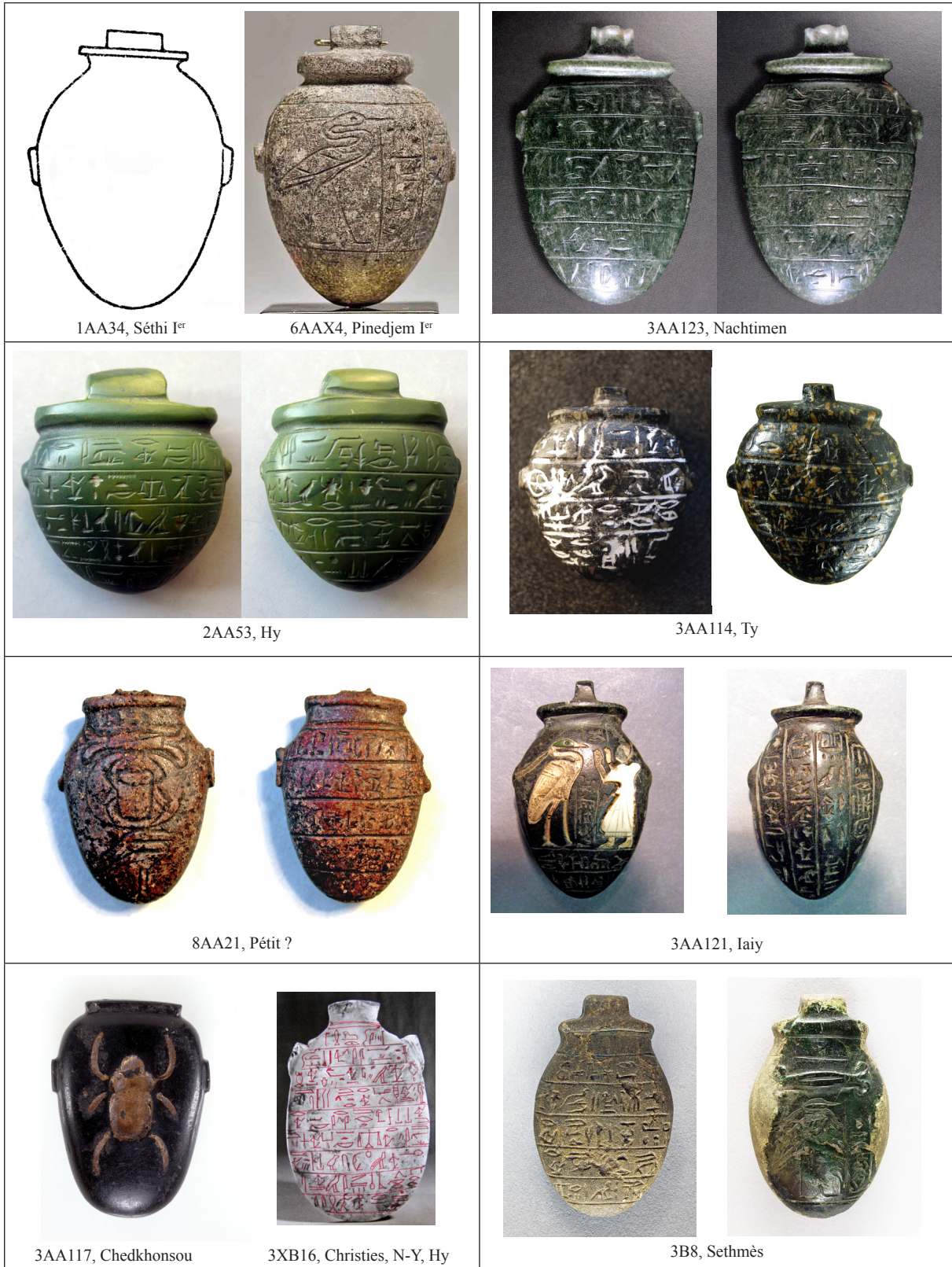
PLANCHE I : AMULETTES CORDIFORMES EN RONDE BOSSE