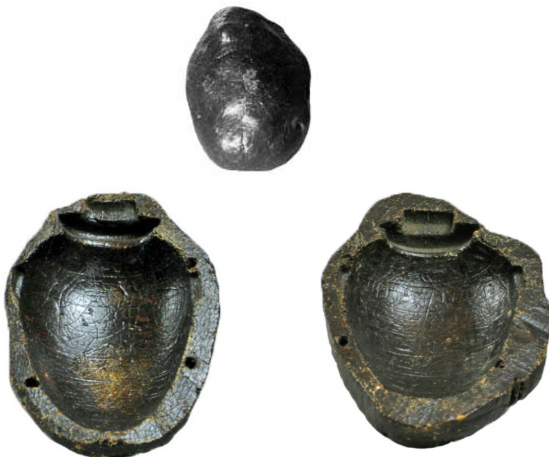
Figure 2. Moule du musée de Brooklyn inv. 37.1758E.

L'amulette CG 12069 réserve d'autres surprises. En effet, le Brooklyn Museum de New York conserve, parmi les objets classés en tant que scarabée de cœur, un moule d'amulette cordiforme (inv. 37.1758 E) (fig. 2). Il provient du fonds Charles Edwin Wilbour, riche